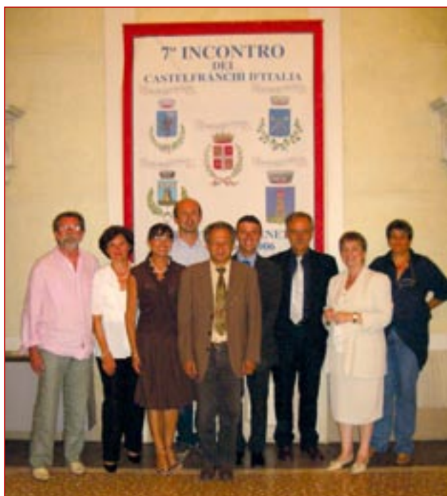
Le delegazioni dei Castelfranchi d'Italia.

Le passeggiate nel Parco hanno permesso di scoprire scorci, colori e riflessi cromatici sempre diversi: alberi e specchi d'acqua, slarghi prativi e macchie di sottobosco, ponticelli e collinette artificiali, e poi architetture "disperse", come la serra in stile ispano-moresco, la cavana, la torre, e, infine, sullo sfondo verso nord, il capolavoro: l'arena-cavallerizza, maneggio prediletto dal conte Revedin,