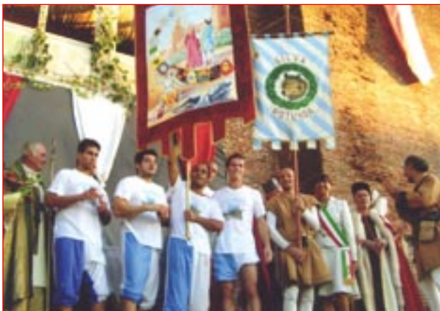
I vincitori del Palio del Castel d'Amore.

La squadra vincente, alla quale è andato il Drappo, opera dell'artista Piera Biliato, è stata nuovamente quella di Resana alla quale la vittoria ha sorriso dopo un combattutissimo e avvincente "duello" con la finalista Bella Venezia che ha difeso con onore i colori della città di Castelfranco. Alla fine, con grande fair play, foto, doni e festa per tutti.