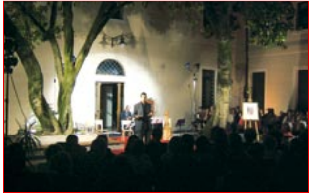
Un momento suggestivo.